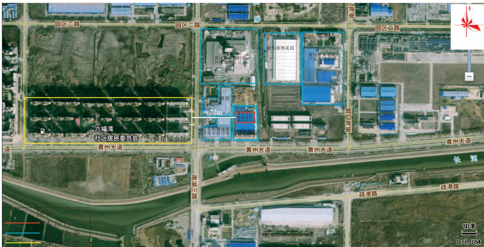
附图2 项目周边关系示意图