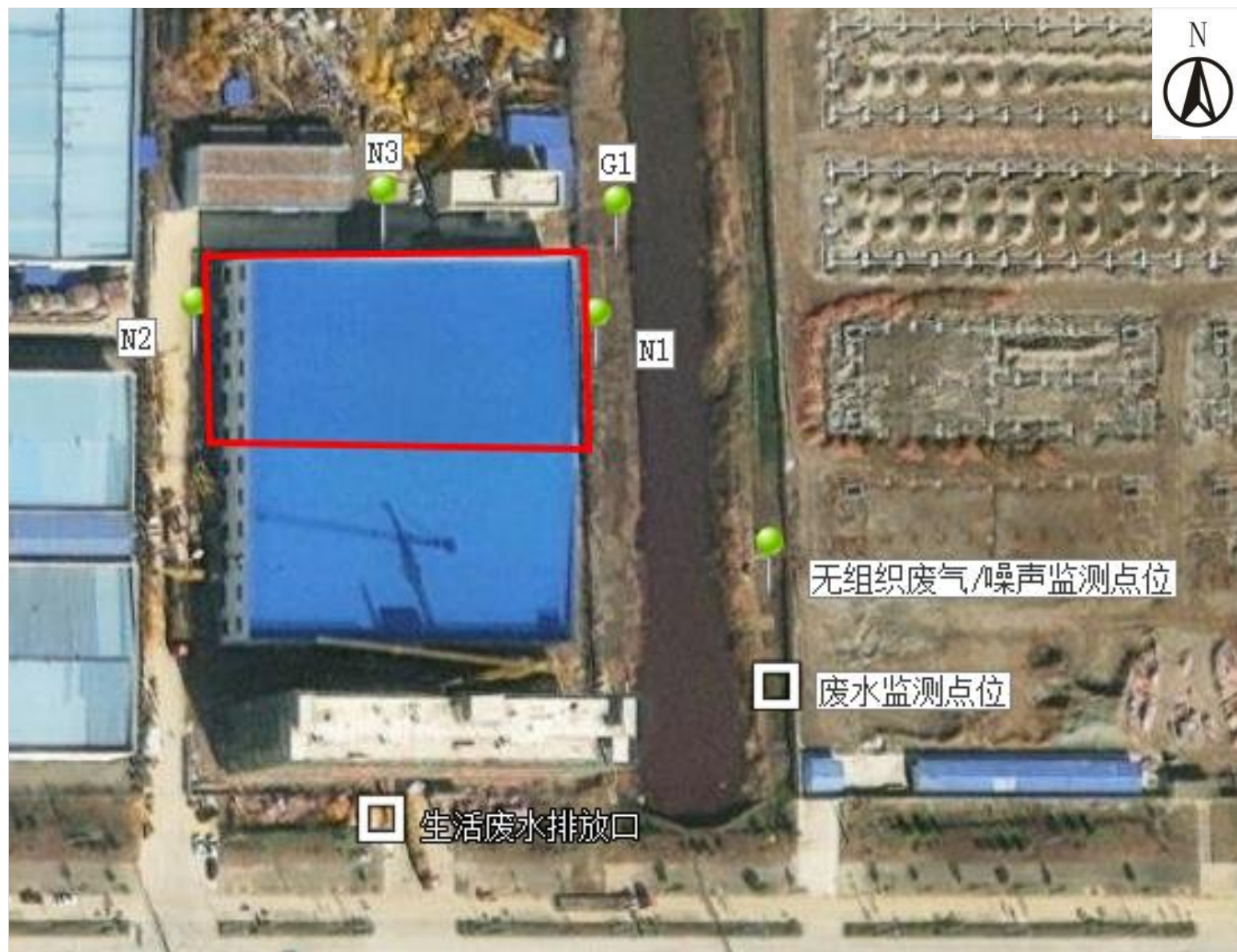
附图5 项目监测点位图