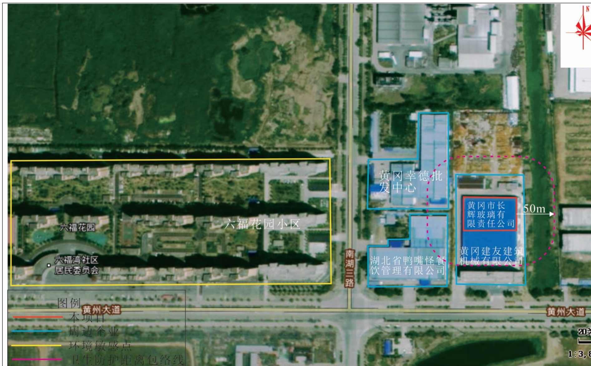
附图 4 项目卫生防护距离包络线图